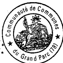
Le Président Etienne PINTE

A la Communauté de Communes du Grand Parc, Le 13 OCT. 2003