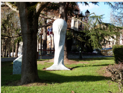
Dans le parc de la Mairie