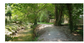
Le long de la Bièvre