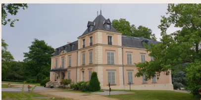
Le château des Roches

Le domaine d'une superficie de 10 ha le long de la Bièvre s'ouvre sur un parc aménagé bordé d'un lac et d'allées de promenade. Un salon de thé et une boutique sont à votre disposition.