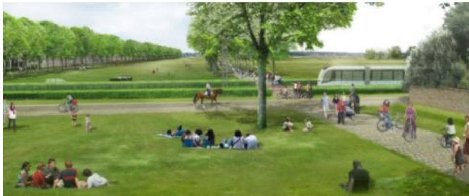
Projet Allée Royale