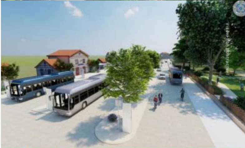
RÉAMÉNAGEMENT DU COEUR DE VILLE AV. JEAN JAURÈS - PÔLE GARE