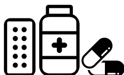
Sans emballage carton et notice papier

Informations : www.cyclamed.org ou application mobile « Mon armoire à pharmacie »