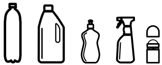
bouteilles, flacons, bidons