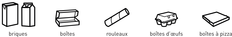
briques boîtes rouleaux boîtes d'œufs boîtes à pizza